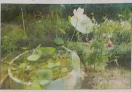
ಶಾಲೆಯ ಕೊಳವೆ ಅರಲರ ತಾಲರ ಹಾಗೂ ಸುಪುಲಯ.

ಪುಣ್ಯಕೊಂಡಿರಲಿವೆ. ಕಾಲರ ಮೂಲಕ ಲಲಿತೆ ಮಾಡಲಾಗಿದೆ. ಸುಪುಲಯ ಕಾಯಿ, ಚೆನ್ನಾಯಿ, ಅಲರಂದಿ, ವಿಜಯಲಕ್ಷ್ಮಿ, ಕುರುಕು, ಮೂಲಂಗಿ, ಗಿಣ್ಣಿ, ಬದಲೇಣಿಯು, ಬಣ್ಣ, ಮೆಂತೆ, ಕೊಕ್ಕಿಲಂಬ, ಪರವೆ, ಪಾಲಕ, ಪುನೀನ ಇತರ 35ಕ್ಕೂ ಹೆಚ್ಚು ತರಕಾರಿ ಹಾಗೂ ಸಿಂಧುಗಳನ್ನು ಉಪಯೋಗಿಸಿ ಲಲಿತವೆ ಮಾಡಲಾಗಿದೆ. ಇವುಗಳನ್ನು ಆಯುಕ್ತ ಲಲಿತೆ ಮಾಡಲಾಗಿದೆ. ವಲರಲ, ಪುಣ್ಯಯು, ಸೀಕಾಫಲ, ನಿಂಬೆ ಇತರ ಪುಣ್ಯಗಳನ್ನು ಲಲಿತೆ ಮಾಡಲಾಗಿದೆ. ಉಪಯುಕ್ತ ಮದರಗಲು ಇರಲಿವೆ. ಅಲರಿಯು 20, ಫಲಲ ಅಲರೀಕೆ 18, ಪಲರಲೆ 4, ಸುಪುಲಯ 1, ವಲರು ಪಲಯ 1, ಸಲರಲೆ 4, ಸುಲರಲೆ 1, ತಲರ 40, ಕಾಯಿ