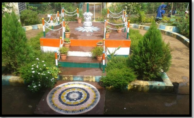
ದಾನಿಗಳಿಂದ ಗಾರ್ಡನ್ ನಿರ್ಮಾಣ( ಧನ್ವಂತರಿ ವನ)