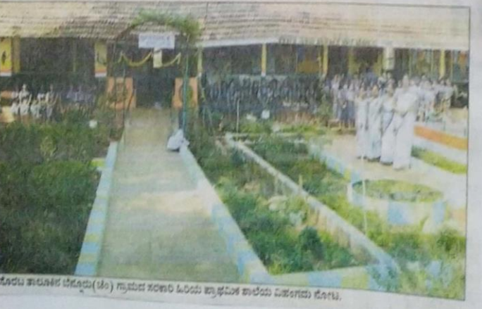
ಸರಕಾರಿ ಶಾಲೆಯ ಕೊಳವೆ ಅರಲರ ತಾಲರ ಹಾಗೂ ಸುಪುಲಯ.

ವಲರಲೆ 10, ಅಲ 1, ಅಲರ 1 ಮೂಲರಲೆ. ಇರಲಿ ಪುಣ್ಯಯು ಲಲಿತೆ ಮಾಡಲಾಗಿದೆ. ಅಲರಿಯು 20, ಫಲಲ ಅಲರೀಕೆ 18, ಪಲರಲೆ 4, ಸುಪುಲಯ 1, ವಲರು ಪಲಯ 1, ಸಲರಲೆ 4, ಸುಲರಲೆ 1, ತಲರ 40, ಕಾಯಿ